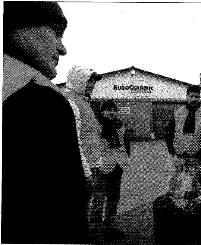
Medewerkers van EuroCeramic in Belfeld staken om sluiting van